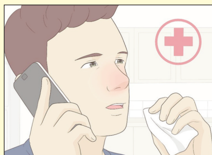
Se tiver necessidade de se deslocar aos serviços de saúde, antes de o fazer contacte-os para saber se existem alternativas.