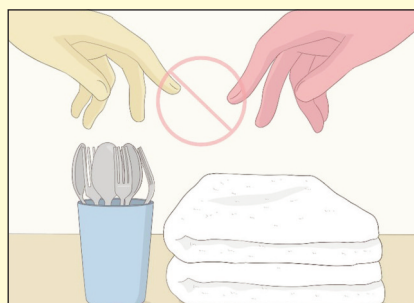
Não partilhe itens, não utilize pratos, copos, utensílios de cozinha, toalhas ou outros objetos.